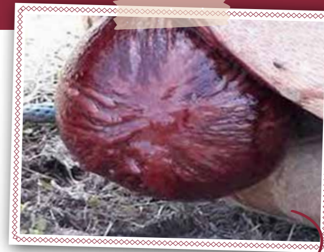
Een red bag is te herkennen aan de rode, fluweelachtige bal. In het midden zie je de cervix ster.

Op de hoefjes ligt het hoofdje. Het veulen wordt met elke wee een stukje verder naar buiten geperst. Dit is hard werken voor de merrie. Deze uitdrijvingsfase duurt ongeveer 20 minuten en mag niet heel veel langer duren omdat de placenta langzaam loslaat en het veulen dus steeds minder zuurstof krijgt. Na de geboorte zal de placenta voorzichtig loslaten van de baarmoederwand en binnen ongeveer een uur volledig naar buiten komen. Dit heet de nageboorte. Als de nageboorte er na twee uur nog steeds niet af is dan is het zaak om de dierenarts te bellen. Als de placenta te lang in de baarmoeder blijft zitten dan kan er een baarmoederontsteking ontstaan. Ga nooit zelf aan een placenta trekken want dit kan de baarmoederwand ernstig beschadigen en kan een inwendige bloeding veroorzaken. Een dierenarts heeft verschillende technieken om een placenta veilig los te krijgen van de baarmoederwand.