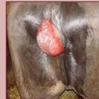
Een prolaps van de vagina.