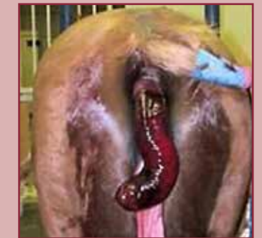
Een prolaps van het rectum.