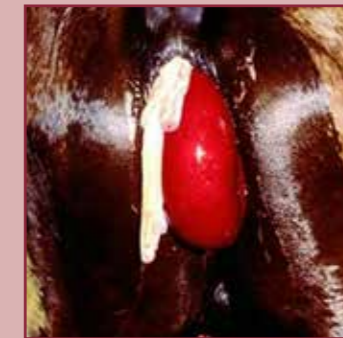
Een prolaps van de blaas.