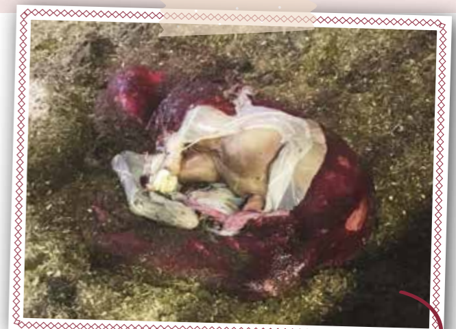
Een mini veulen wat het helaas niet gered heeft. Hier is duidelijk de witte pootjesblaas met daaromheen de rode waterblaas te zien.

Omdat het veulen zuurstofgebrek heeft gehad is er een kans op een dummy veulen. Een dummy veulen reageert een beetje sloom, loopt doelloos rond, gaat niet naar de uier van de merrie en heeft geen zuigreflex. Omdat het erg belangrijk is dat een veulen zo snel mogelijk