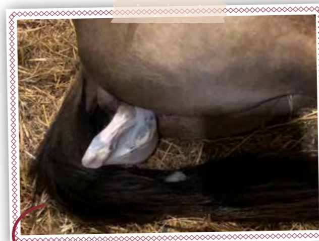
Bij een normale geboorte zie je als eerste de witte pootjesblaas.

De pootjesblaas met daarin het veulen wordt naar buiten geperst. Vanaf de eerste weeën duurt het ongeveer 10 minuten voordat je de pootjesblaas ziet. Je ziet dan als eerste de hoefjes naar buiten komen in een witte zak, dat is de pootjesblaas. Het ene hoefje zit meestal net iets verder naar achteren en de hoefjes wijzen naar beneden toe.