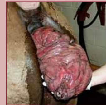
Een prolaps van de baarmoeder.

Het zijn niet de meest smakelijke beelden maar wel belangrijk om te bekijken. Prolapsen kunnen soms lijken op een red bag, en in een prolaps mag je absoluut niet snijden! Het is daarom belangrijk dat je het verschil herkent!